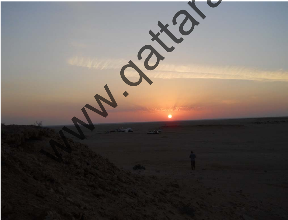
Gebel Sanhur: Ultimi raggi di luce sul campo base catturati da una delle alture a nord.