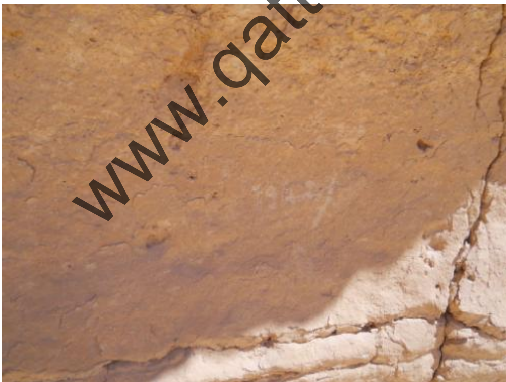
Passo del Cammello: la scritta sulla parete di quella che era una grotta ricovero annessa all'ospedale del passo del cammello, riporta la data 1942.