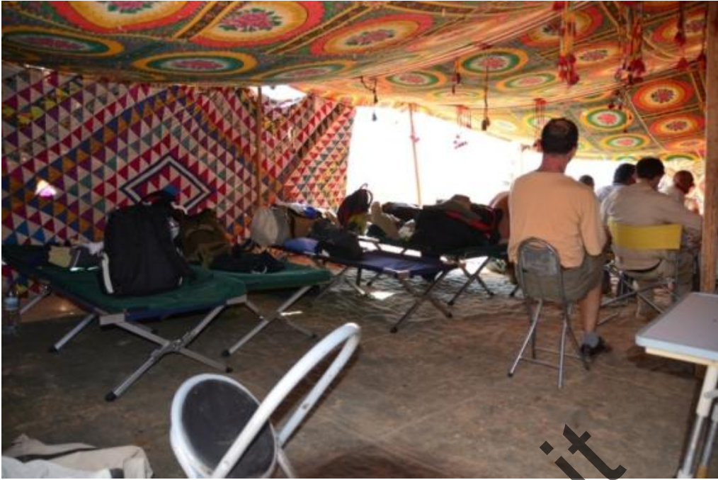
Gebel Sanhur: uno dei lati dormitorio della grande tenda beduina .