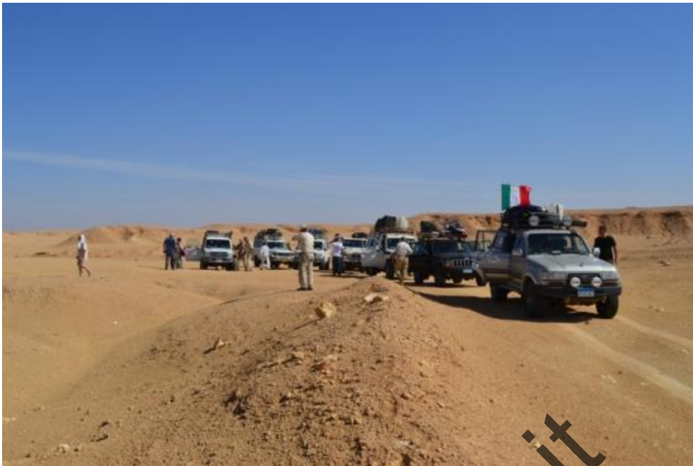
Passo del Cammello: tutti pronti a salire in auto, a breve si partirà per WEST ABU DWEISS