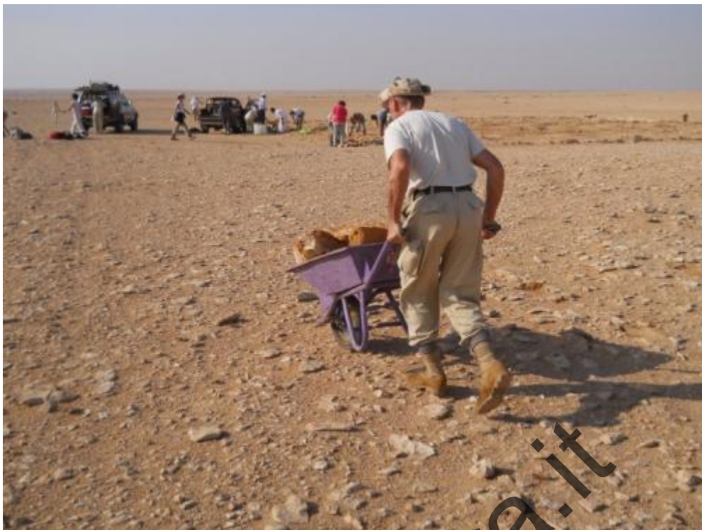
Cimitero Italiano di Gebel Sanhur: Tutti collaborano attivamente.