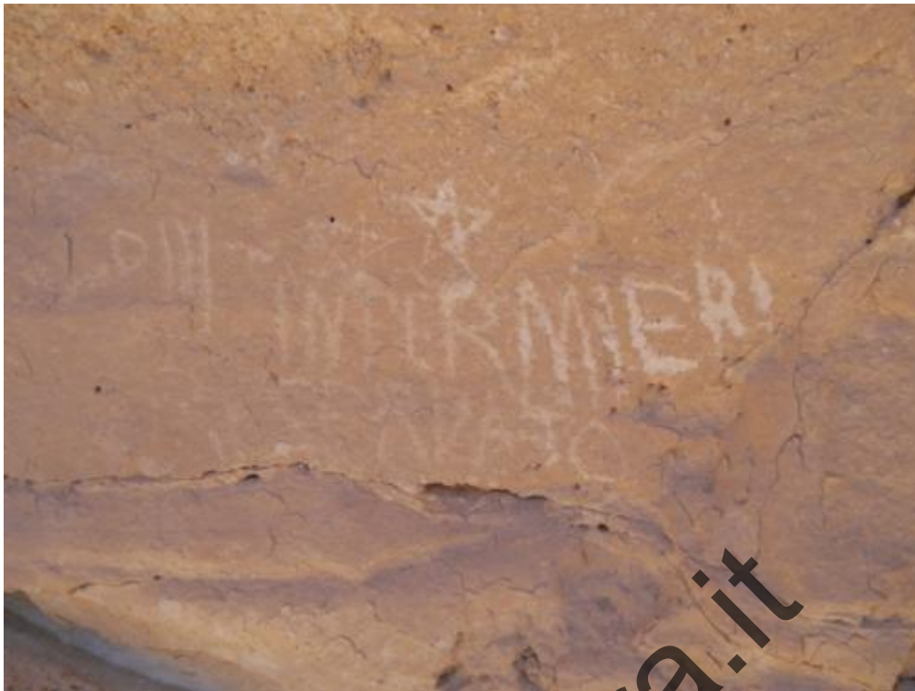
Passo del Cammello: la scritta sulla parete di quella che era una grotta ricovero annessa all'ospedale del passo del cammello, riporta la scritta in italiano INFERMIERI RISERVATO.