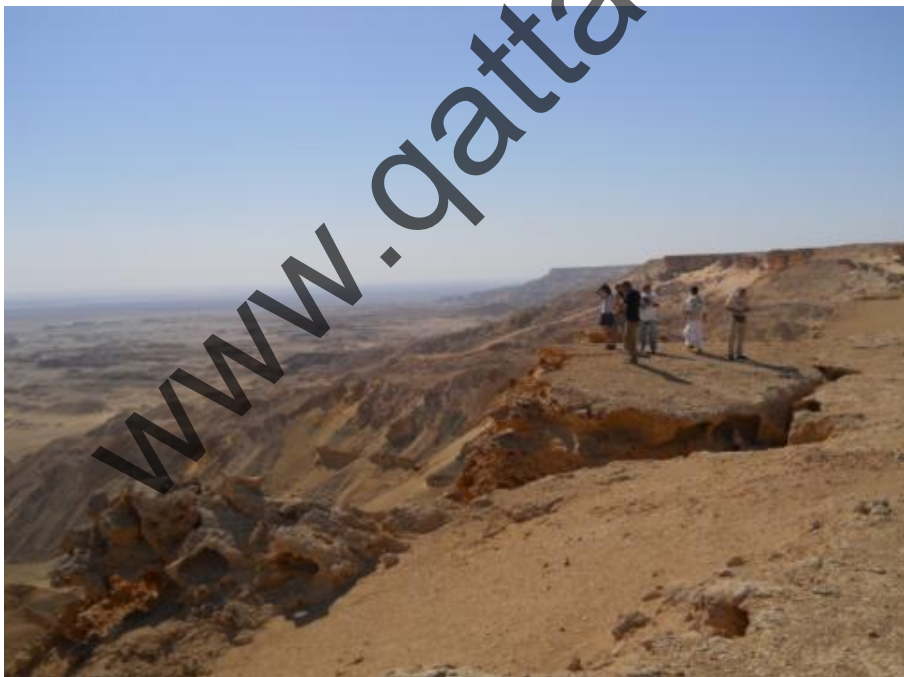
WEST ABU DWEISS: la depressione di Qattara si apre ai nostri occhi centinaia di metri sotto di noi. Questo è uno dei punti più panoramici e coinvolgenti sulla grande depressione.