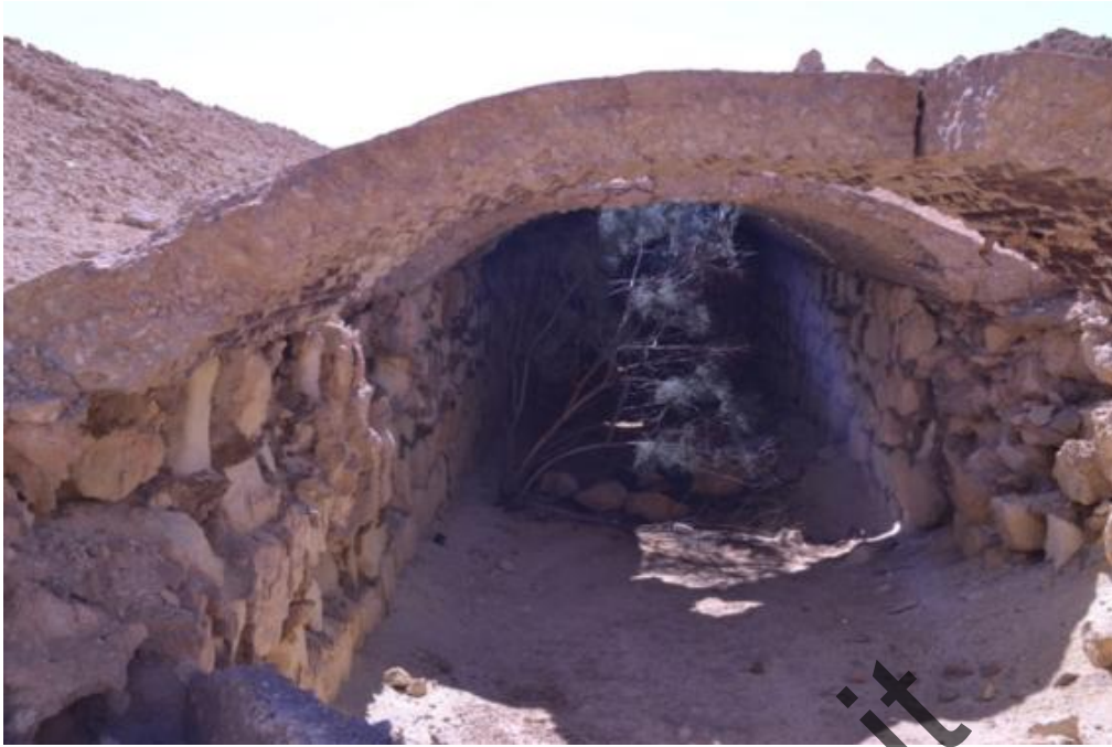
Passo del Cammello: la struttura semi crollata dell'ospedale