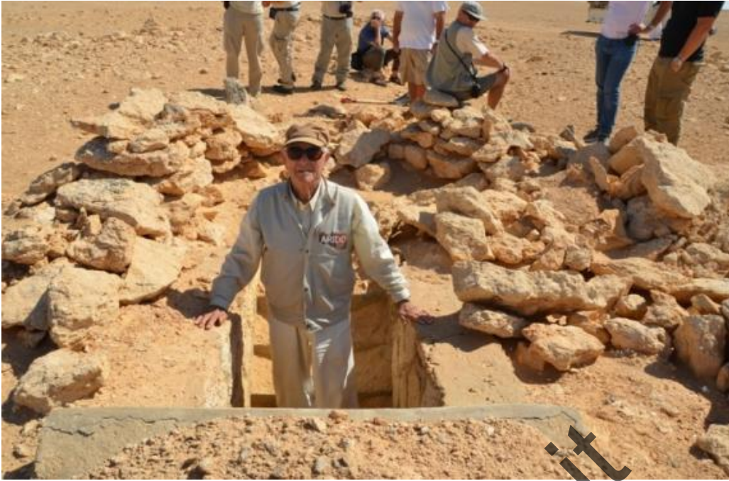
WEST ABU DWEISS: Santo scende nel bunker.