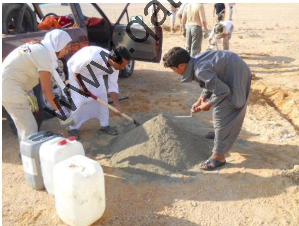
Cimitero Italiano di Gebel Sanhur: Tutti collaborano attivamente.