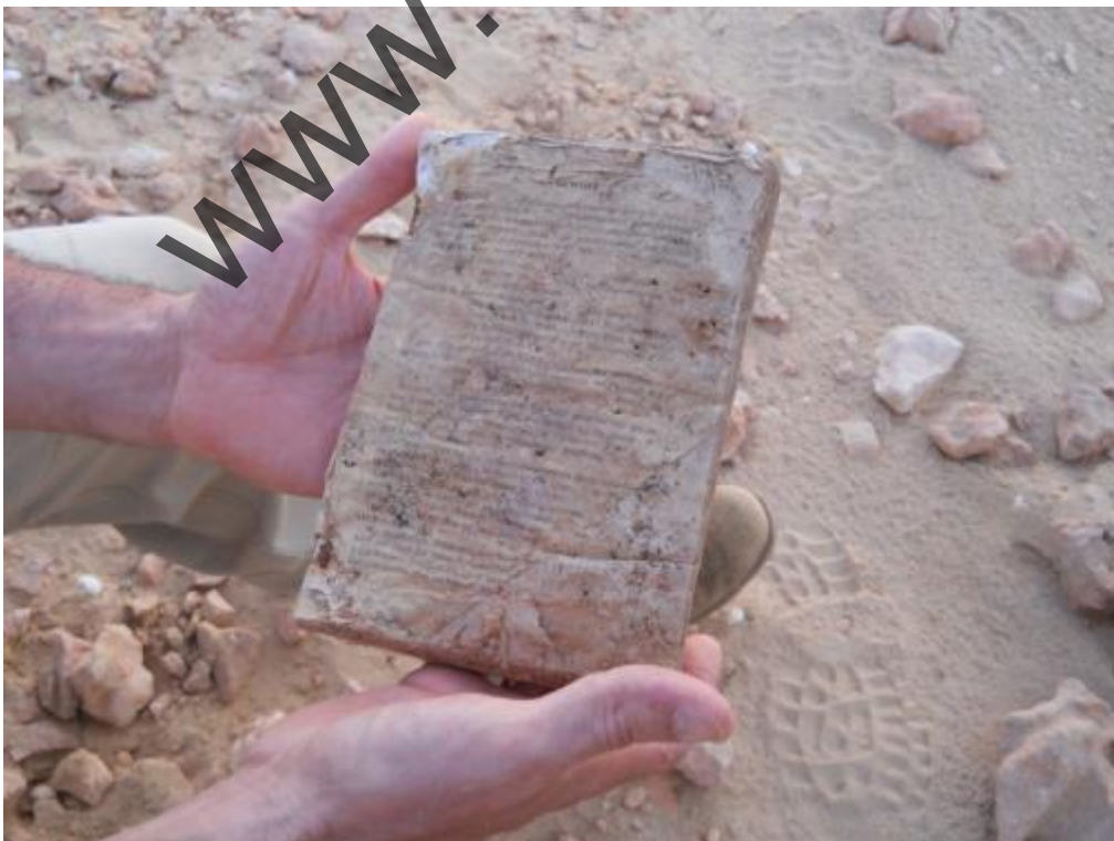
Gebel Sanhur: manuale di meccanica in lingua tedesca.

Gebel Sanhur: Tra le decine di oggetti ritrovati, residuati, personali, parti di uniformi etc etc non possiamo evitare di menzionare un manuale di meccanica in lingua tedesca, ancora in buone condizioni che verrà prontamente restaurato.