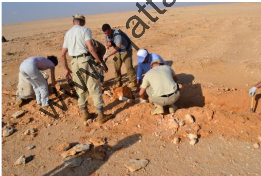
Cimitero Italiano di Gebel Sanhur: Tutti collaborano attivamente.