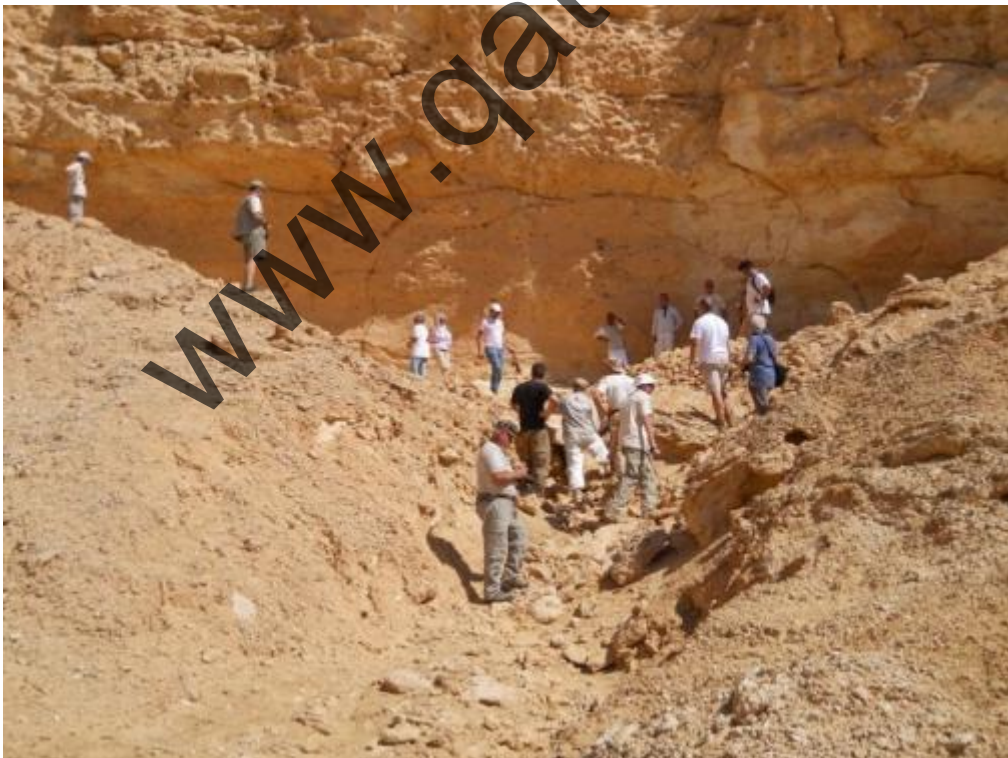
Passo del Cammello: Uno delle nuove parti recentemente scoperte da ARIDO.