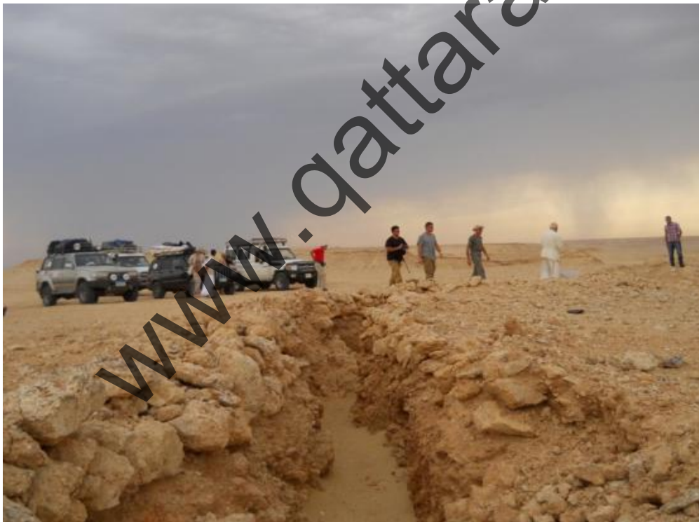
Foto ricordo, esplorazione e domande tecniche e storiche non mancano: il capo spedizione sempre presente risponde soddisfacendo le richieste di tutti.

Dopo pranzo e sotto un cielo ormai plumbeo saliamo su fino a Naqb Rifa alla trincea grande.