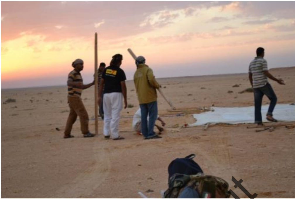
Gebel Sanhur: preparazione e allestimento del campo base