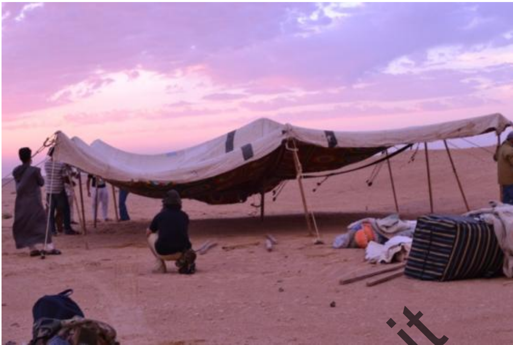
Gebel Sanhur: preparazione e allestimento del campo base