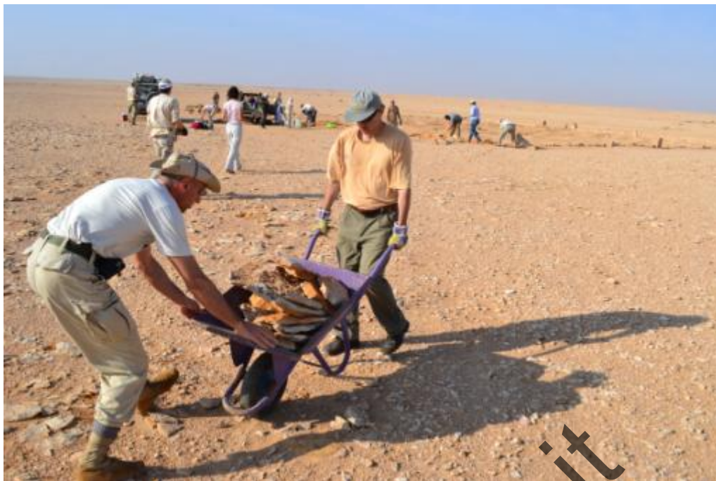
Cimitero Italiano di Gebel Sanhur: Tutti collaborano attivamente.