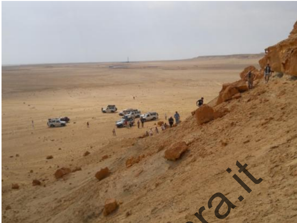
Un gruppo di partecipanti sale fino al gruppo di grotte del lato sud del Himeimat.