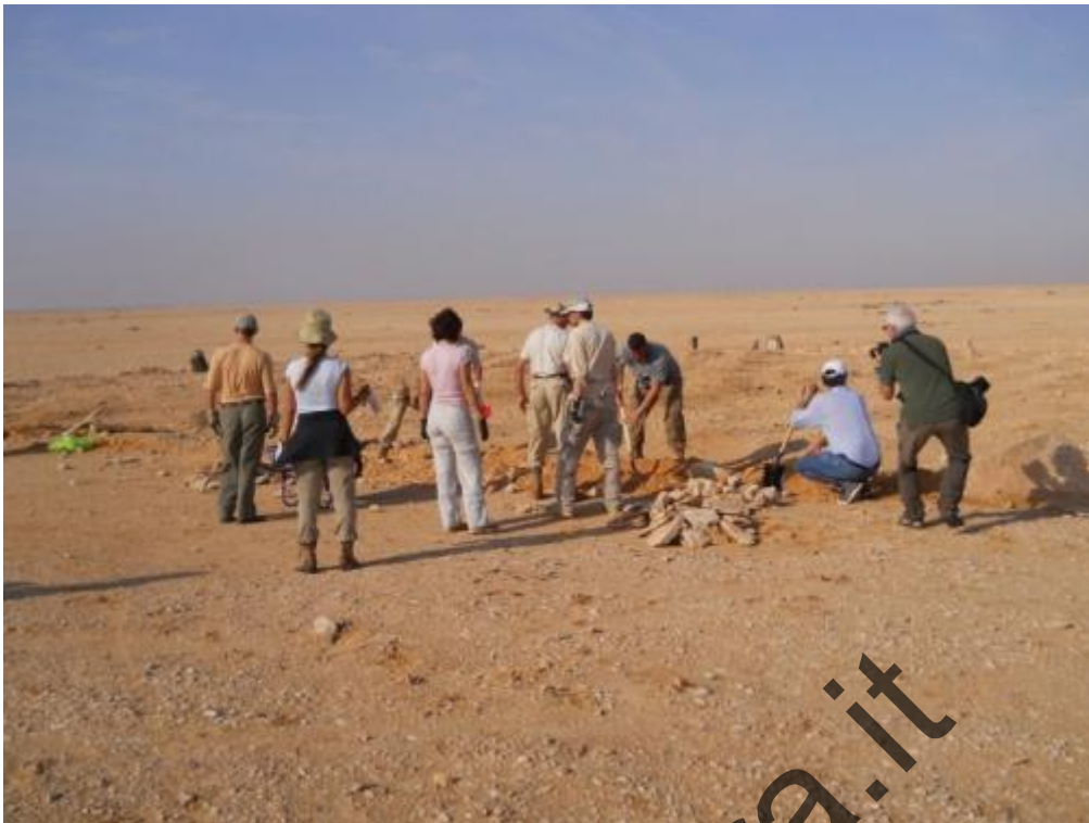
Cimitero Italiano di Gebel Sanhur: inizio dei lavori

RESOCONTO COMPLETO DEI LAVORI AL CIMITERO NEL PROSSIMO ARTICOLO ESCLUSIVO IN USCITA A BREVE SU QUESTO SITO.