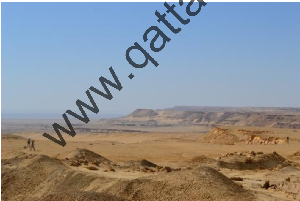
Passo del Cammello: vista sulla depressione di Qattara