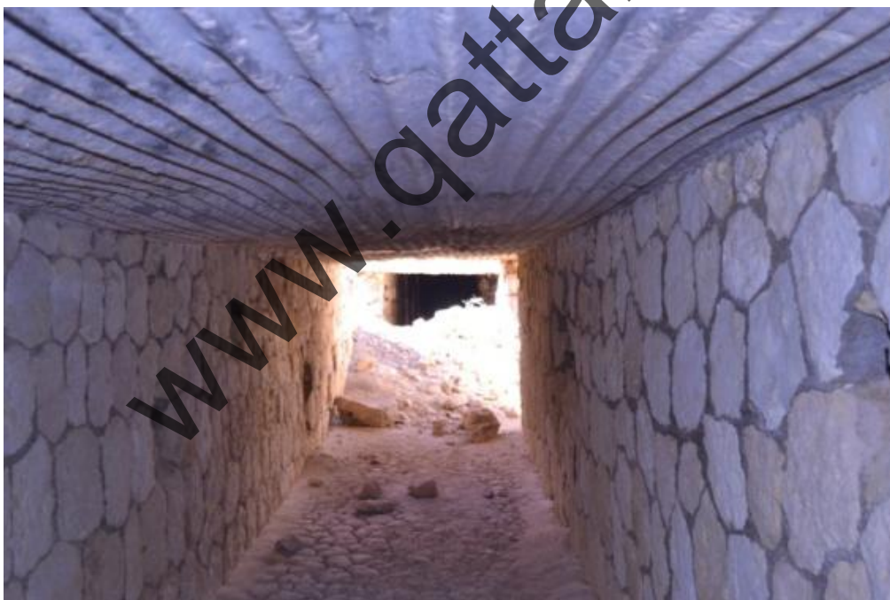
Passo del Cammello: la struttura semi crollata dell' ospedale