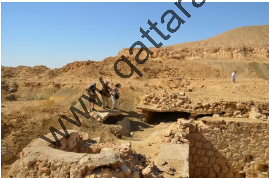
Passo del Cammello: la struttura semi crollata dell' ospedale