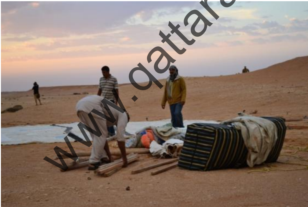
Gebel Sanhur: preparazione e allestimento del campo base