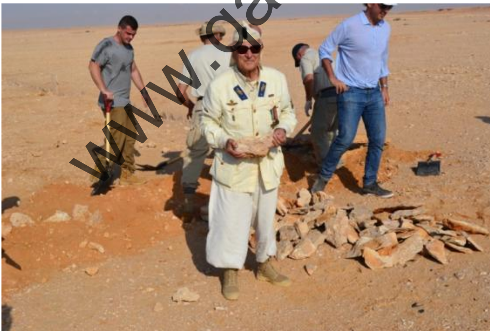
Cimitero Italiano di Gebel Sanhur: Tutti collaborano attivamente.

RESOCONTO COMPLETO DEI LAVORI AL CIMITERO NEL PROSSIMO ARTICOLO ESCLUSIVO IN USCITA A BREVE SU QUESTO SITO.