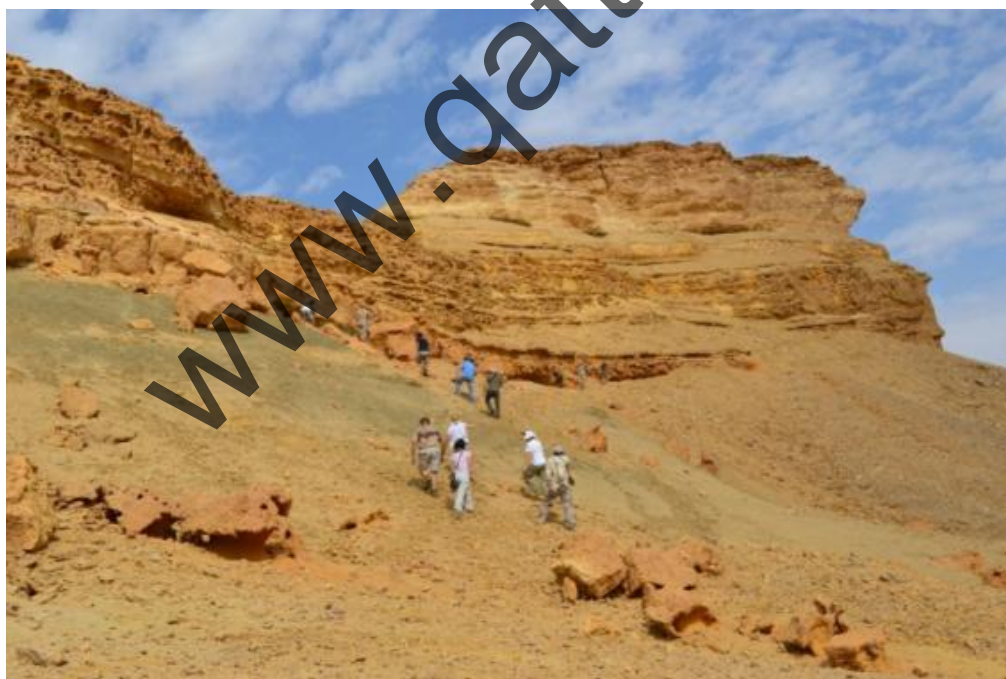
Un gruppo di partecipanti sale fino al gruppo di grotte del lato sud del Himeimat.