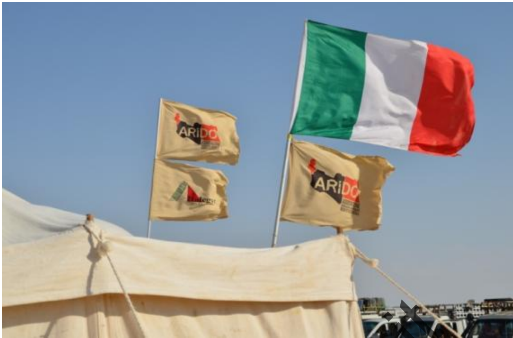
Gebel Sanhur: a fine giornata le bandiere garriscono nel vento ancora caldo di una giornata senza nuvole .