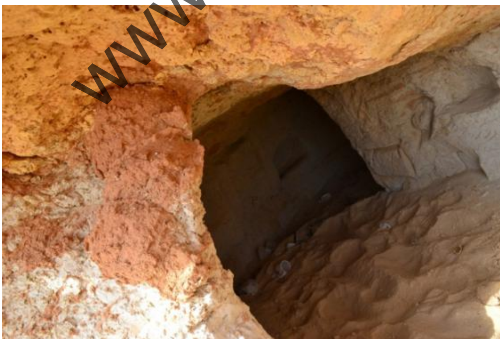
Una delle grotte dell'Himeimat con l'ingresso rivolto a Sud.

Il tempo continua a scorrere veloce e, da vero tiranno quale è solito mostrarsi, rincara la dose quando il sole si incontra con banchi di nuvole che risalgono da ovest, riducendo di molto la luce del giorno....quasi a voler anticipare il tramonto che comunque a breve arriverà.