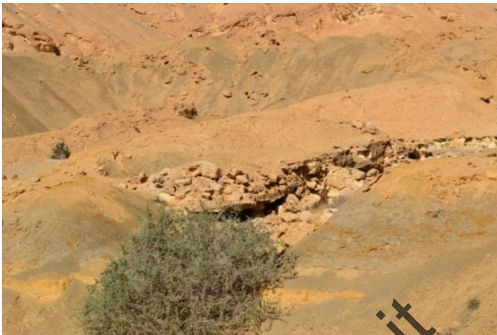
Passo del Cammello: la struttura semi crollata dell' ospedale