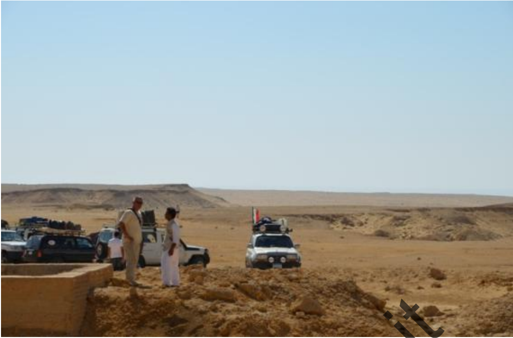
Passo del Cammello: Vista dei balzi prima della depressione, catturata dalla struttura semi crollata dell'ospedale.