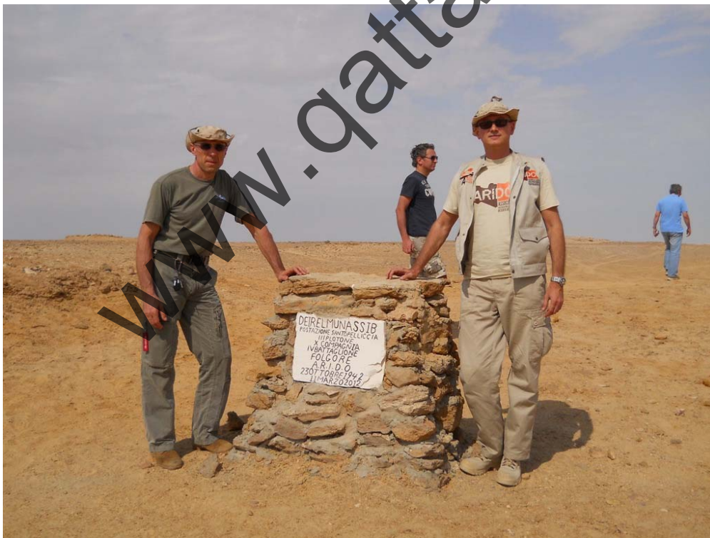
Il cippo in onore di Santo Pelliccia ed il 4to Folgore.