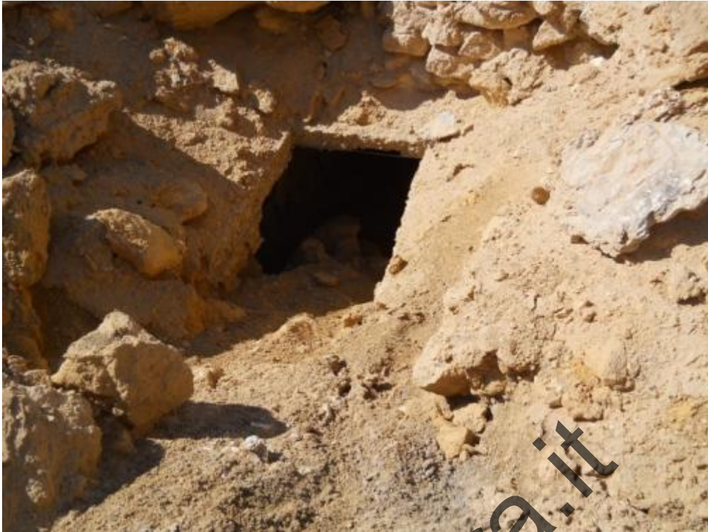
Passo del Cammello: primi accessi alla parte sotterranea