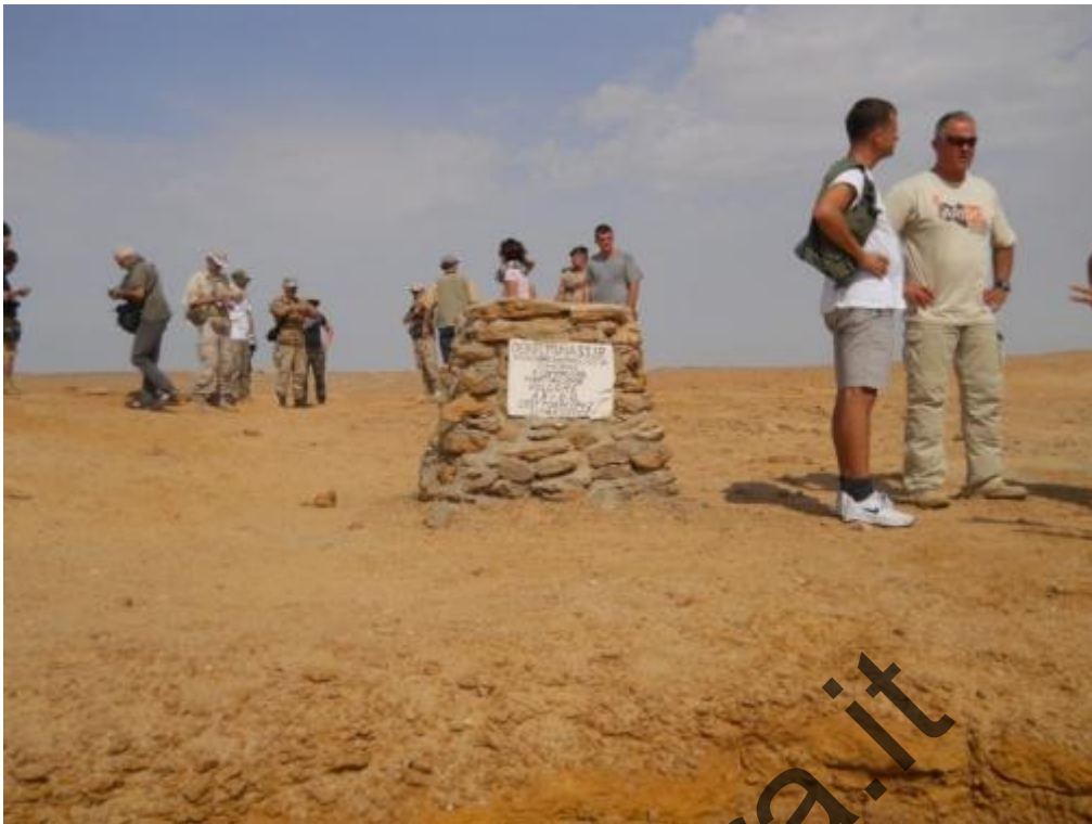
Il cippo in onore di Santo Pelliccia ed il 4to Folgore.