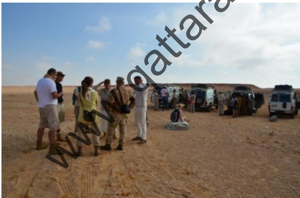
Gebel Sanhur: ultimi accordi e si parte.