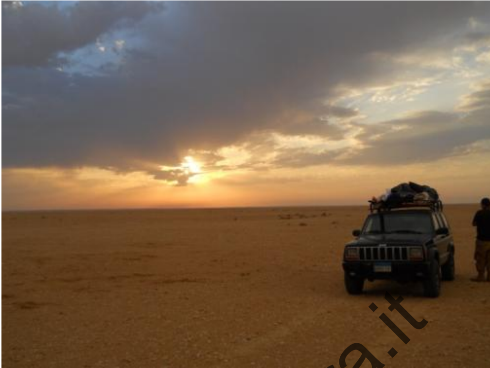
Pianoro di Qaret El Khadem, ore 16;00 del 16 Ottobre 2012, la pioggia battente crea una atmosfera surreale.