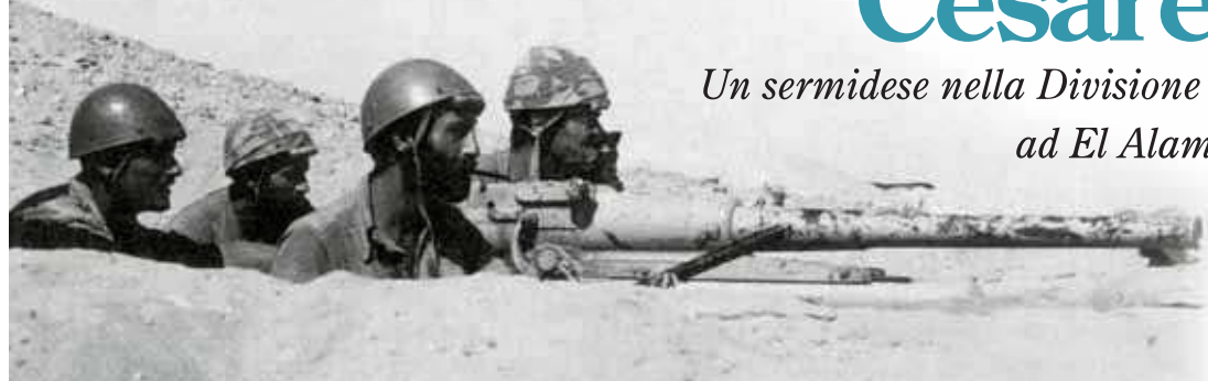
Una postazione controcarro nel settore della Divisione Paracadutisti Folgore a El Alamein

Un sermidese nella Divisione Paracadutisti Folgore ad El Alamein