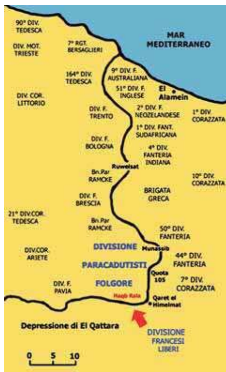
Disposizione dei reparti all'inizio della Battaglia di El Alamein il 23 Ottobre 1942