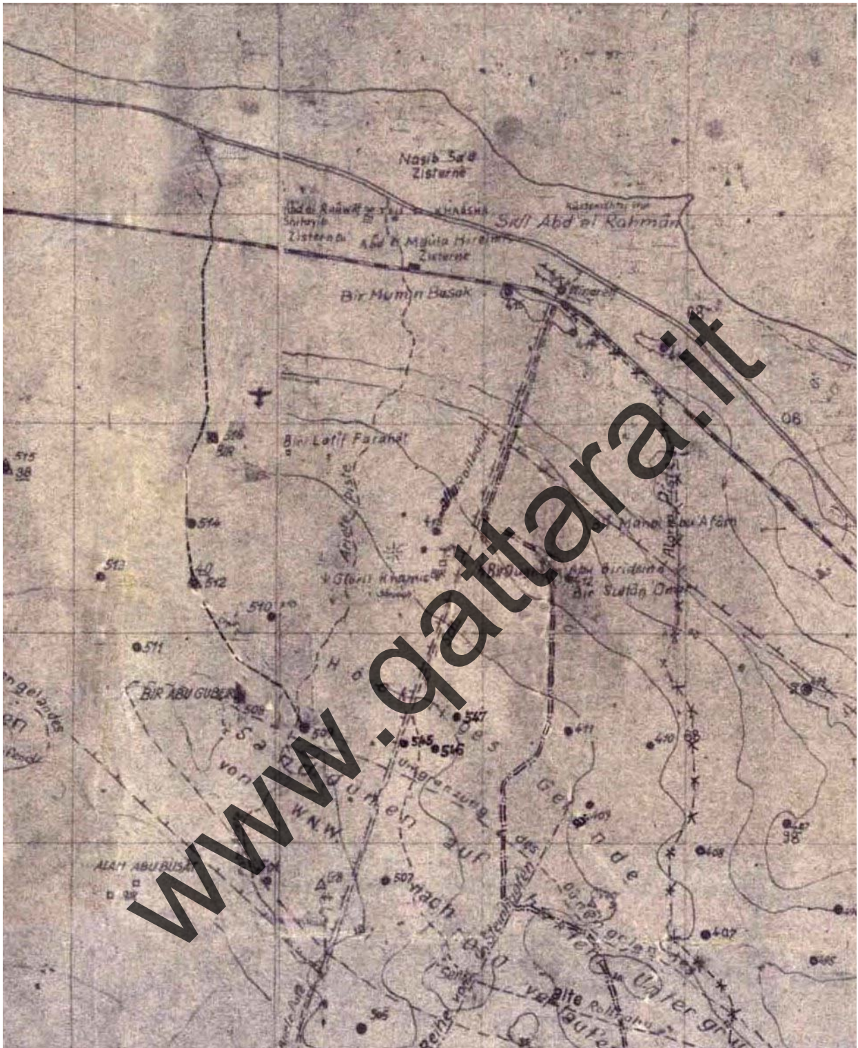
Carta tedesca del 1942 (particolare)