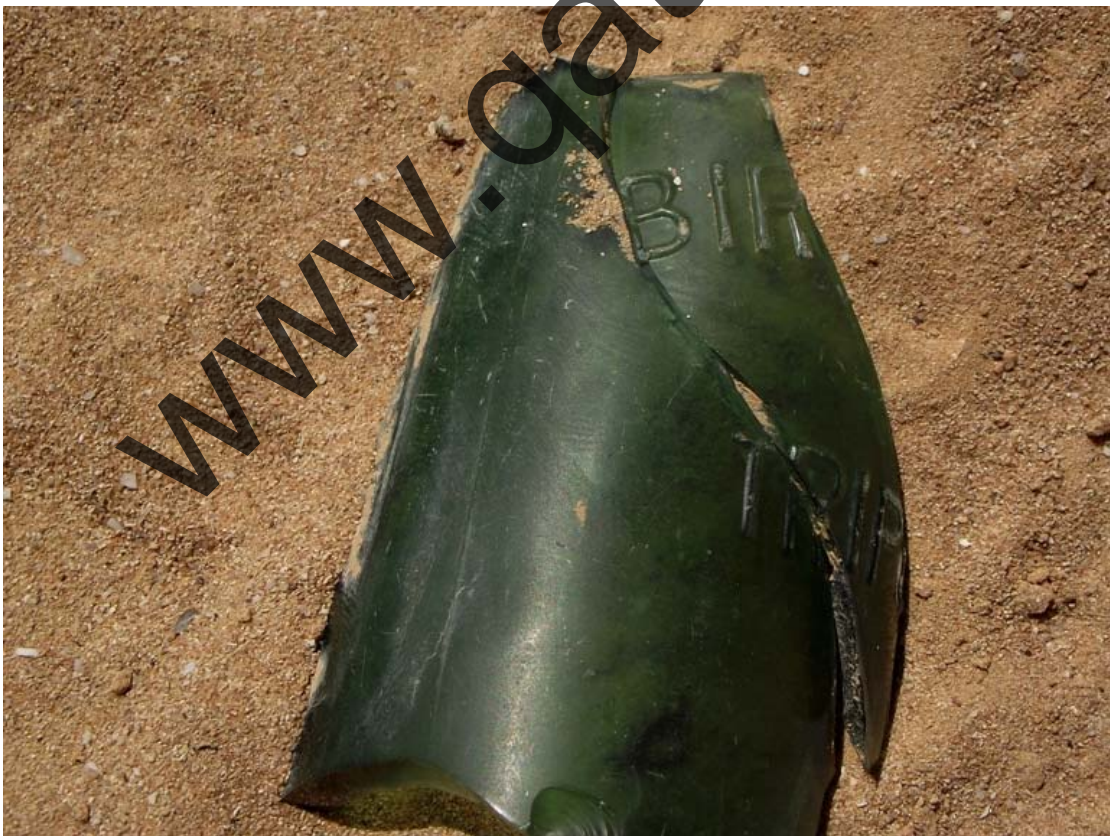
Bottiglia di BIRRA OEA TRIPOLI