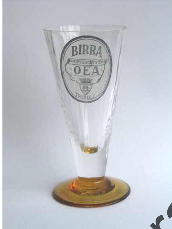
Bicchiera con stemma di BIRRA OEA TRIPOLI