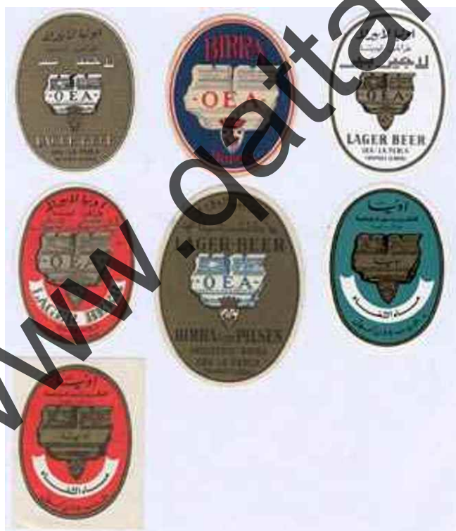
Sottobicchiere ed etichette di BIRRA OEA TRIPOLI