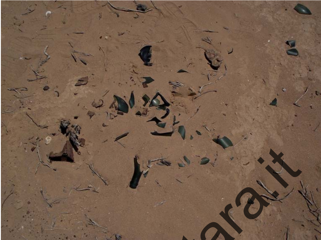
Bottiglie italiane rotte che indicano la riesumazione dei corpi