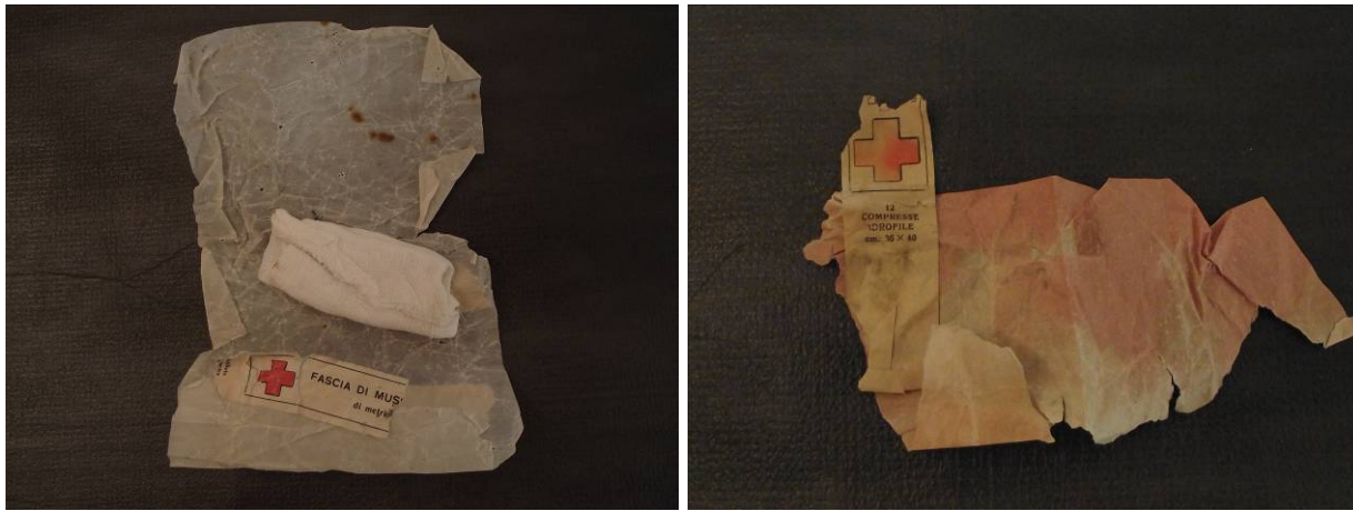
2 Diverse confezioni di garza sterile per medicazioni: la Garza sterile nella confezione di sinistra e' originale ed era arrotolata all'interno della carta oleata di protezione.