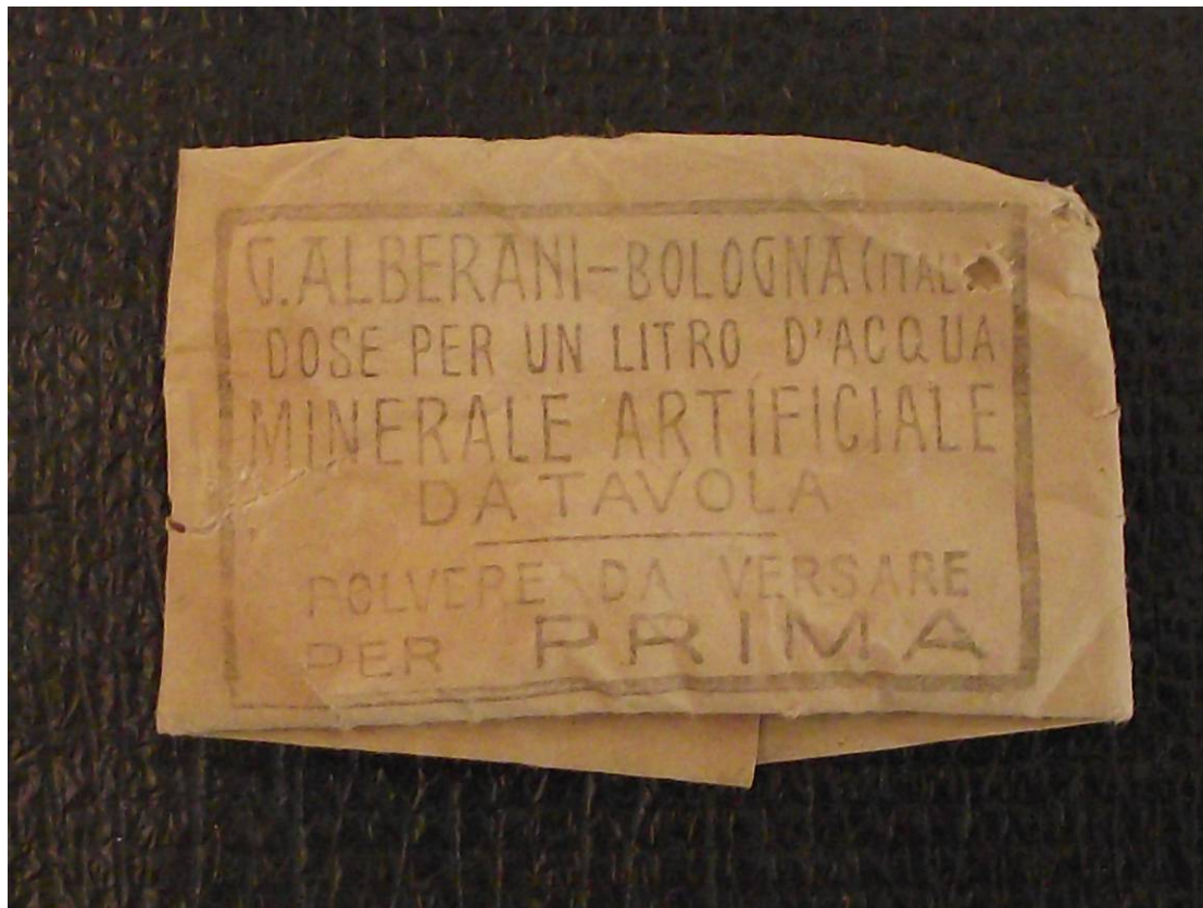
2 Bustine di marca diversa di preparato chimico per ottenere acqua minerale