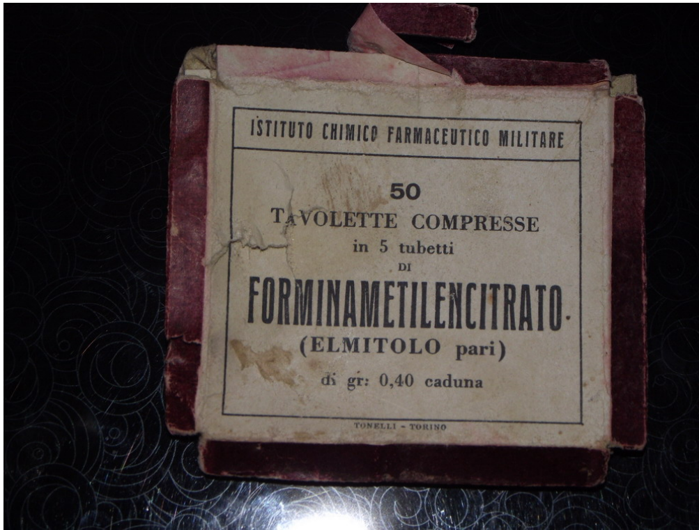
Prodotto in compresse utilizzato come antisettico delle vie urinarie