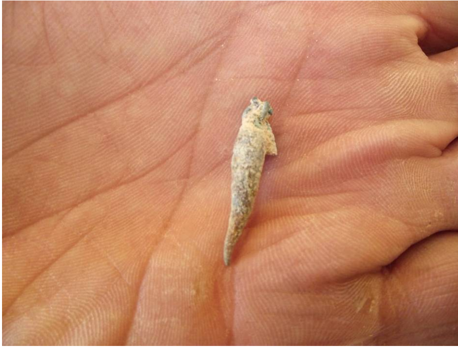
Piccolo cornetto porta fortuna in argento