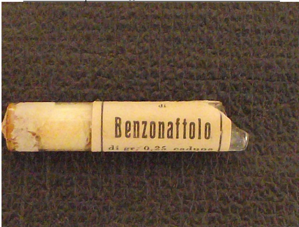
Benzonaftolo: molto usato in passato come disinfettante intestinale